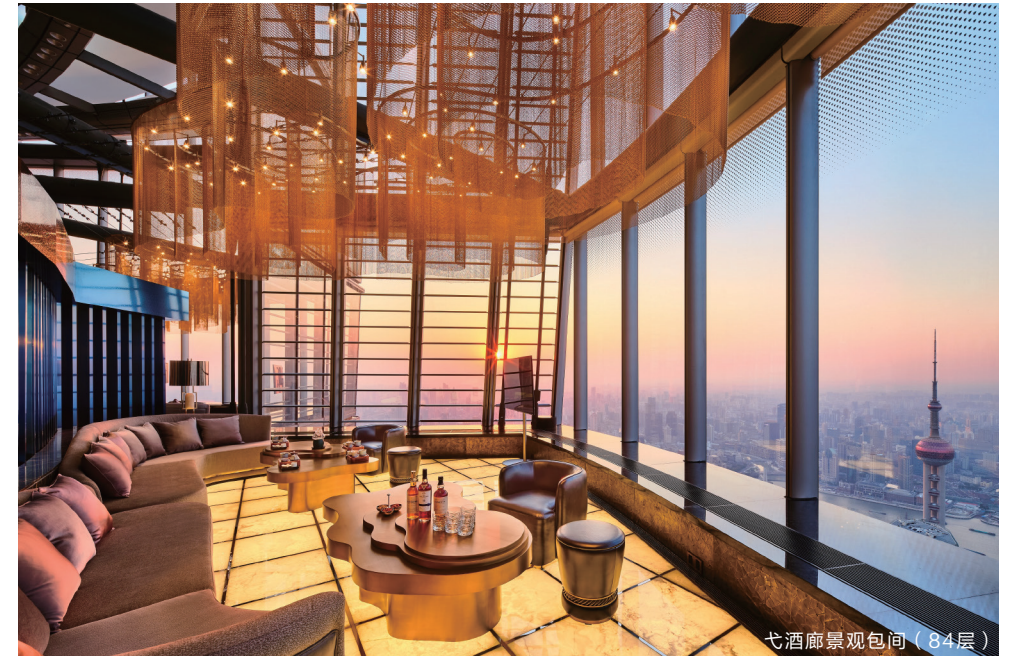
弋酒廊景观包间 (84层)