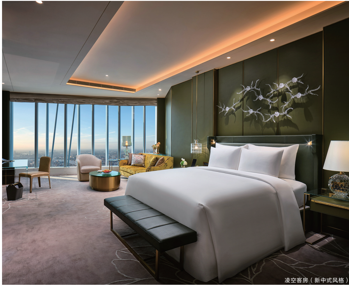
凌空客房（新中式风格）