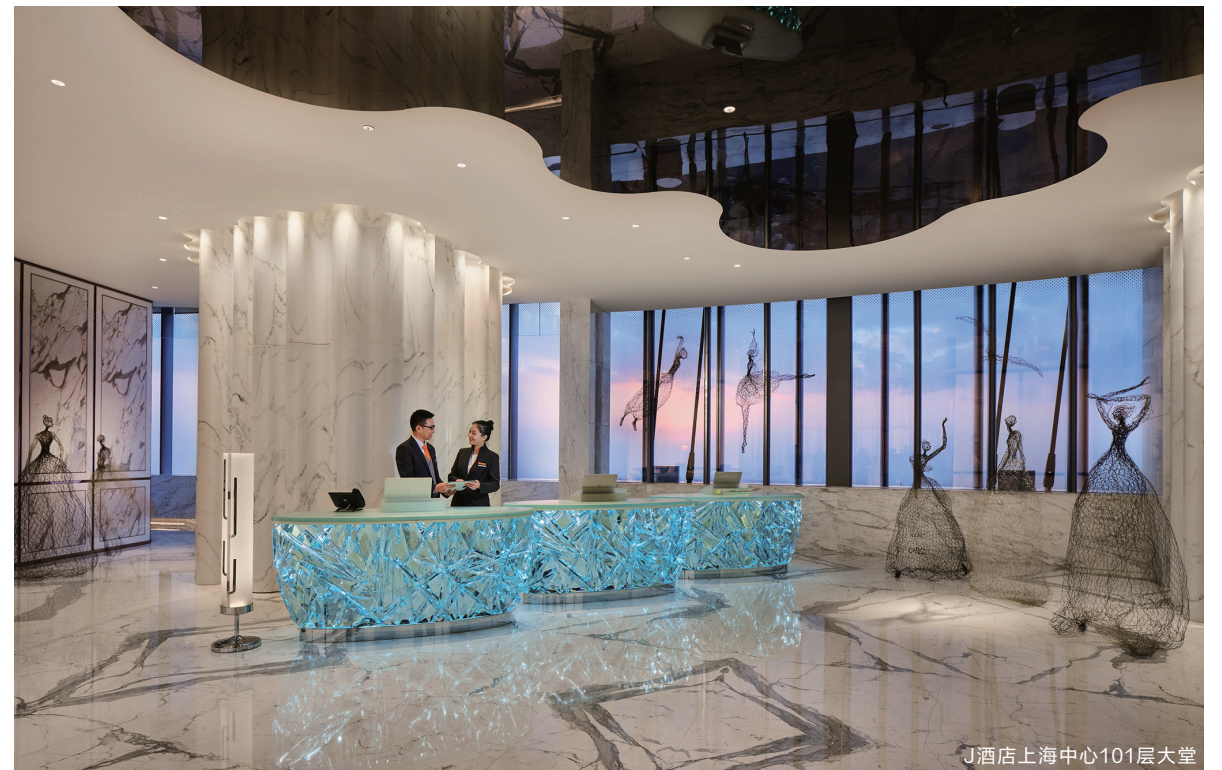
J酒店上海中心101层大堂

沿着酒店前庭经过6根水晶罗马柱，再穿过高达8米的上海石库门，宾客似已穿越中西进入一个曼妙的设计艺术空间。乘坐高速电梯直达101层，随着夹丝玻璃的走廊墙面和金属镜面的天花构建而成的时空“天桥”便来到了酒店大堂。在这个云端艺术之境，设计师大胆运用了中国传统的漆雕，琉璃和珐琅工艺，同时选用金属、水晶和马赛克等材质进行空间打造，一步一景，整个酒店处处体现了设计师的巧思。同时，酒店邀请了国内外艺术家量身定制了各种风格的艺术作品，漫步其间，仿佛置身于一个精心筹备的艺术展。