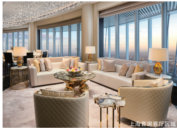
上海套房客厅区域