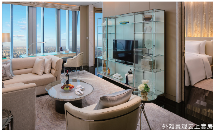
外滩景观云上套房