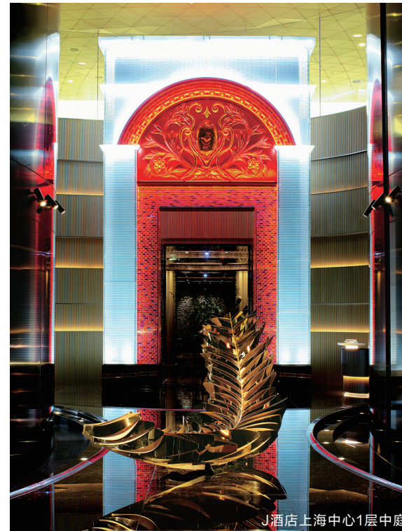
J酒店上海中心1层中庭

作为J品牌的第一家旗舰店，J酒店上海中心旨在打造一家展现当代艺术美学及中国传统文化的奢华酒店，成为高端民族酒店品牌发展的里程碑，在上海这个东西方文化的交汇点解读本土文化对自身与世界的理解。