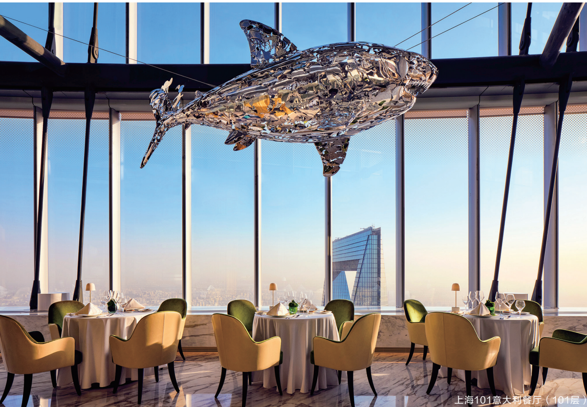
上海101意大利餐厅 (101层)