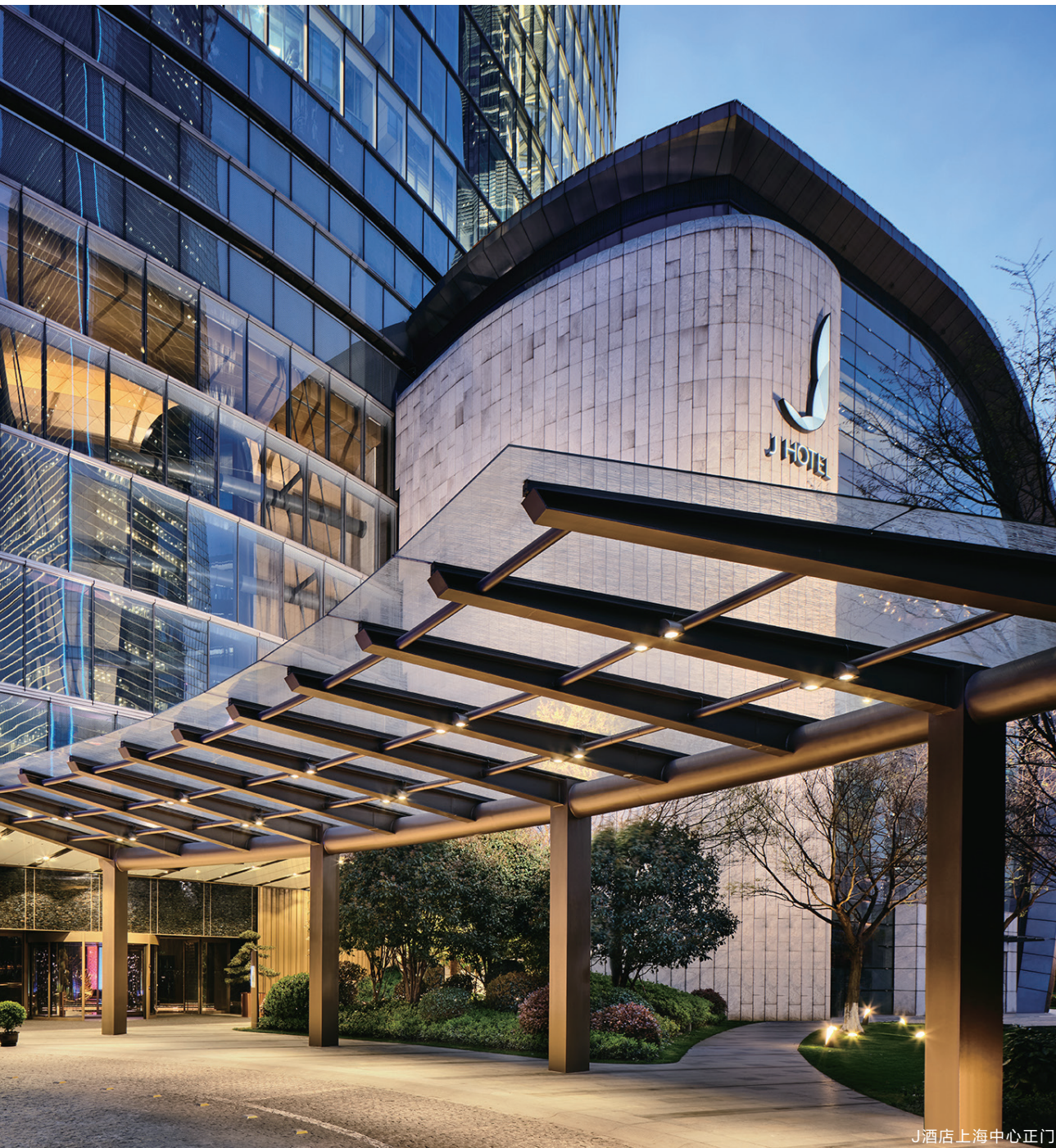
J酒店上海中心正门

作为J品牌的第一家旗舰店，J酒店上海中心旨在打造一家展现当代艺术美学及中国传统文化的奢华酒店，成为高端民族酒店品牌发展的里程碑，在上海这个东西方文化的交汇点解读本土文化对自身与世界的理解。